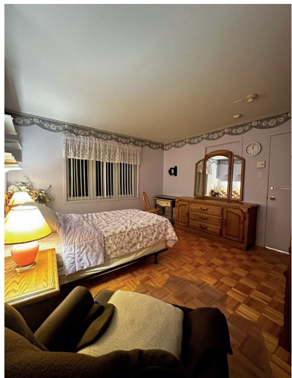
*Prix sujet à changement sans préavis